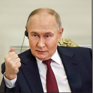
ਅਧਿਕਾਰੀਆਂ ਅਨੁਸਾਰ, ਇਸ ਰੂਸੀ ਟੈਂਕਰ ਨੂੰ ਫੜਨ ਲਈ ਹਫ਼ਤਿਆਂ ਤੱਕ ਇਸ ਦਾ ਪਿੱਛਾ ਕੀਤਾ ਗਿਆ ਸੀ। ਟੈਂਕਰ ਨੇ ਪਹਿਲਾਂ ਵੀ ਅਮਰੀਕੀ ਨਾਵਾਬਦੀ