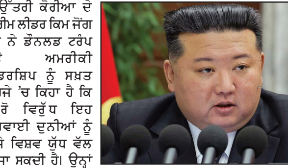
ਉੱਤਰੀ ਕੋਰੀਆ ਦੇ ਸੁਪਰੀਮ ਲੀਡਰ ਕਿਮ ਜੋਂਗ ਉਨ ਨੇ ਡੋਨਲਡ ਟਰੰਪ ਅਤੇ ਅਮਰੀਕੀ ਲੀਡਰਸ਼ਿਪ ਨੂੰ ਸਖ਼ਤ ਲਹਿਜੇ 'ਚ ਕਿਹਾ ਹੈ ਕਿ ਮਦੂਰੋ ਵਿਰੁੱਧ ਇਹ ਕਾਰਵਾਈ ਦੁਨੀਆਂ ਨੂੰ ਤੀਜੇ ਵਿਸ਼ਵ ਯੁੱਧ ਵੱਲ ਲੈ ਜਾ ਸਕਦੀ ਹੈ। ਉਨ੍ਹਾਂ ਮੰਗ ਕੀਤੀ ਹੈ ਕਿ ਅਮਰੀਕਾ ਤੁਰੰਤ ਮਦੂਰੋ ਦੀ ਮੌਜੂਦਾ ਸਥਿਤੀ ਨੂੰ ਜਨਤਕ ਕਰੇ ਤੇ ਉਨ੍ਹਾਂ ਨੂੰ ਬਿਨਾਂ ਕਿਸੇ ਦੇਰੀ ਦੇ ਰਿਹਾਅ

ਨਿਊ ਯੋਰਕ: ਅਮਰੀਕਾ ਵਲੋਂ ਵੈਨੇਜ਼ੂਏਲਾ ਦੇ ਰਾਸ਼ਟਰਪਤੀ ਨਿਕੋਲਸ ਮਦੂਰੋ ਤੇ ਉਨ੍ਹਾਂ ਦੀ ਪਤਨੀ ਸਿਲਿਆ ਫ਼ਲੋਰੇਜ਼ ਨੂੰ ਹਿਰਾਸਤ 'ਚ ਲਏ ਜਾਣ ਤੋਂ ਬਾਅਦ ਦੁਨੀਆਂ ਭਰ 'ਚ ਹਲਚਲ ਤੇਜ਼ ਹੋ ਗਈ ਹੈ। ਹੁਣ ਇਸ ਲੜਾਈ 'ਚ ਉੱਤਰੀ ਕੋਰੀਆ ਦੇ ਤਾਨਾਸ਼ਾਹ ਕਿਮ ਜੋਂਗ ਉਨ ਨੇ ਵੀ ਐਂਟਰੀ ਕਰ ਲਈ ਹੈ। ਕਿਮ ਨੇ ਮਦੂਰੋ ਨੂੰ ਆਪਣਾ ਇੱਕ ਖ਼ਾਸ ਦੋਸਤ ਦੱਸਦਿਆਂ ਅਮਰੀਕਾ ਨੂੰ ਤੀਜੇ ਵਿਸ਼ਵ ਯੁੱਧ ਦੀ ਚਿਤਾਵਨੀ ਦਿੱਤੀ ਹੈ।